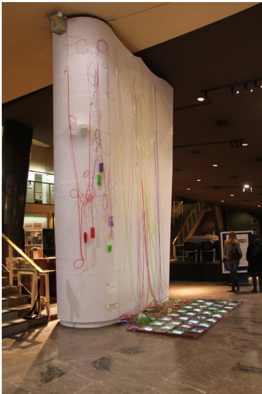
Homo Energeticus , Muestra Inferencias Vitales, Teatro General San Martín, intervención en las columnas del Hall.