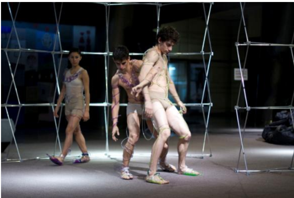
Fotos Performance Homo Energeticus