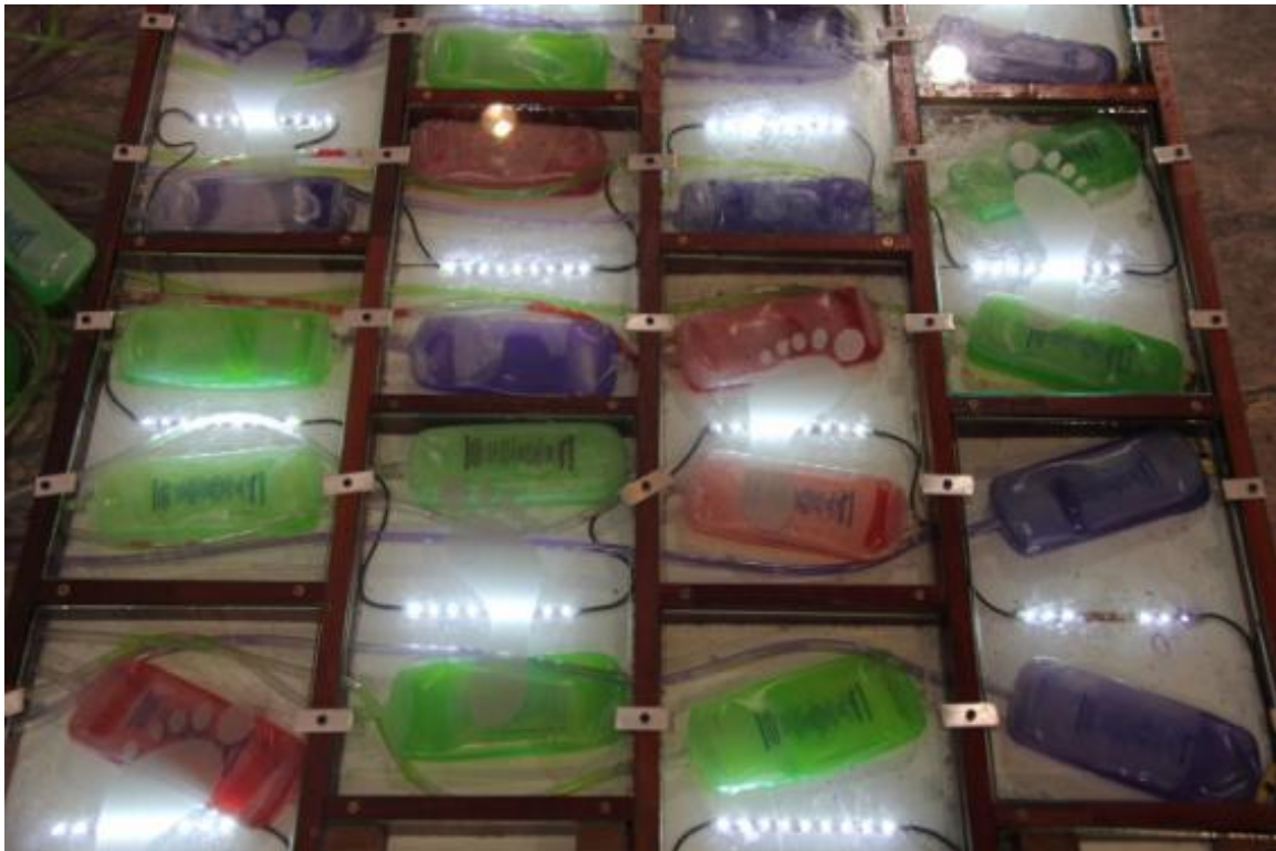
Homo Energético , Muestra Inferencias Vitales, Teatro General San Martín